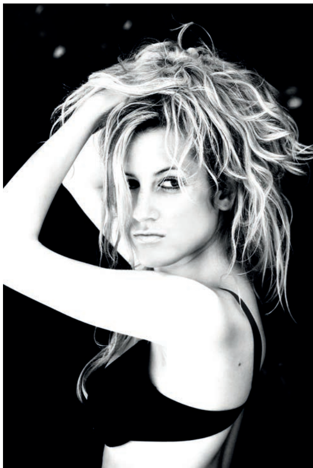
Półportret, „przypadkowe” ujęcie.