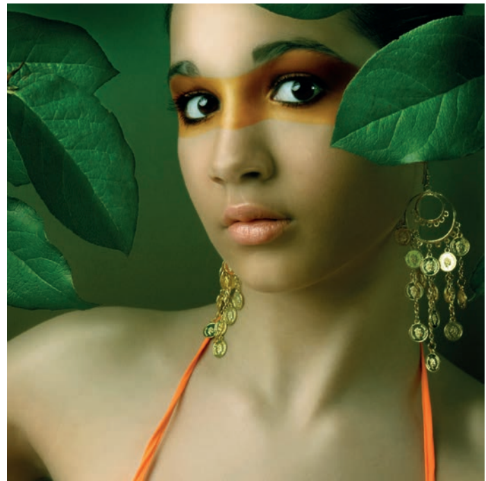
Profesjonalny portret w stylu glamour.

Fotograf hobbysta musi dość często być gotowy na kompromis i bądź to znaleźć modelkę, która sama potrafi wykonać perfekcyjny makijaż, bądź rozwinąć w sobie ponadprzeciętne umiejętności w obsłudze programów do obróbki zdjęć cyfrowych. Taka kombinacja funkcjonuje niekiedy tak dobrze, że rezultat może być lepszy niż zdjęcia profesjonalistów.