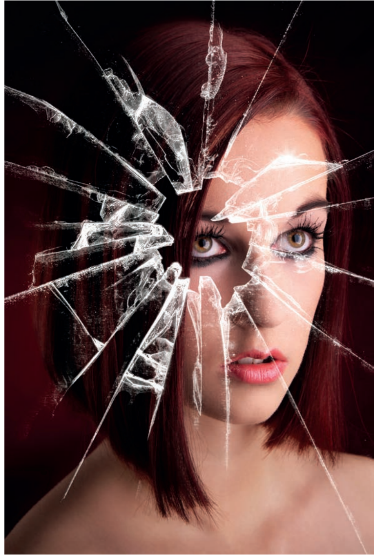
Portret zrealizowany w studiu fotograficznym w salonie. wizażystka: Stephanie Hertel

Jeśli nie zniechęciłeś się jeszcze trudnościami, którym będziesz musiał stawić czoła, śmiało zabieraj się do dzieła!