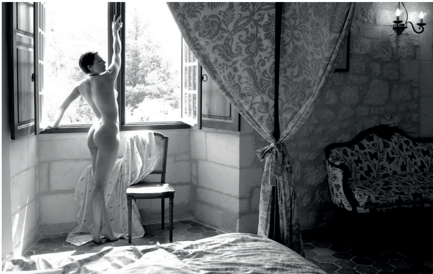
Kunstowna aranżacja za pomocą rekwizytów.

Tła z winylu lub podobnych materiałów można zmywać, jednak również one rzadko wytrzymują trudy kilkugodzinnej sesji. Ich wysoka cena sprawia, że w przypadku poważniejszych uszkodzeń i konieczności ich wymiany na nowe budżet zostaje mocno uszczuplony.