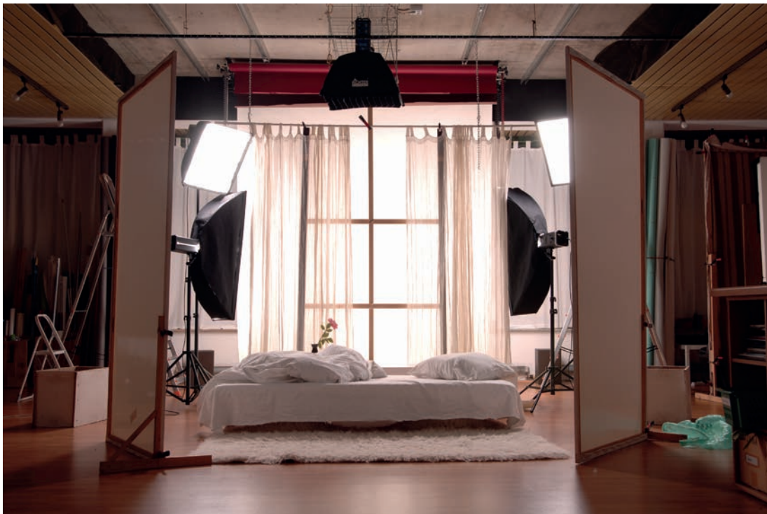
Profesjonalne studio fotograficzne Gero Gröschela.