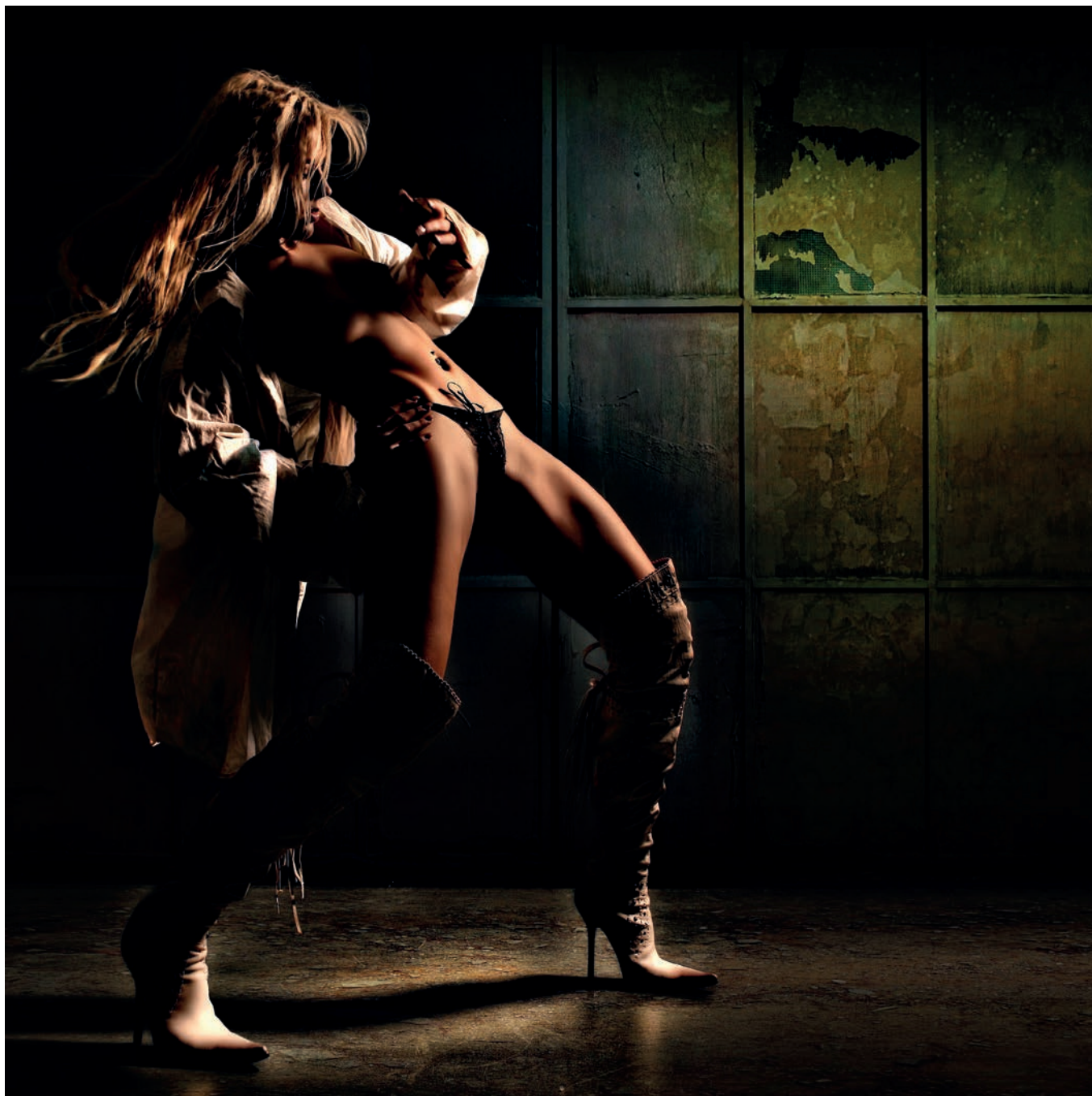
„Fotografia działa również bez słów”.