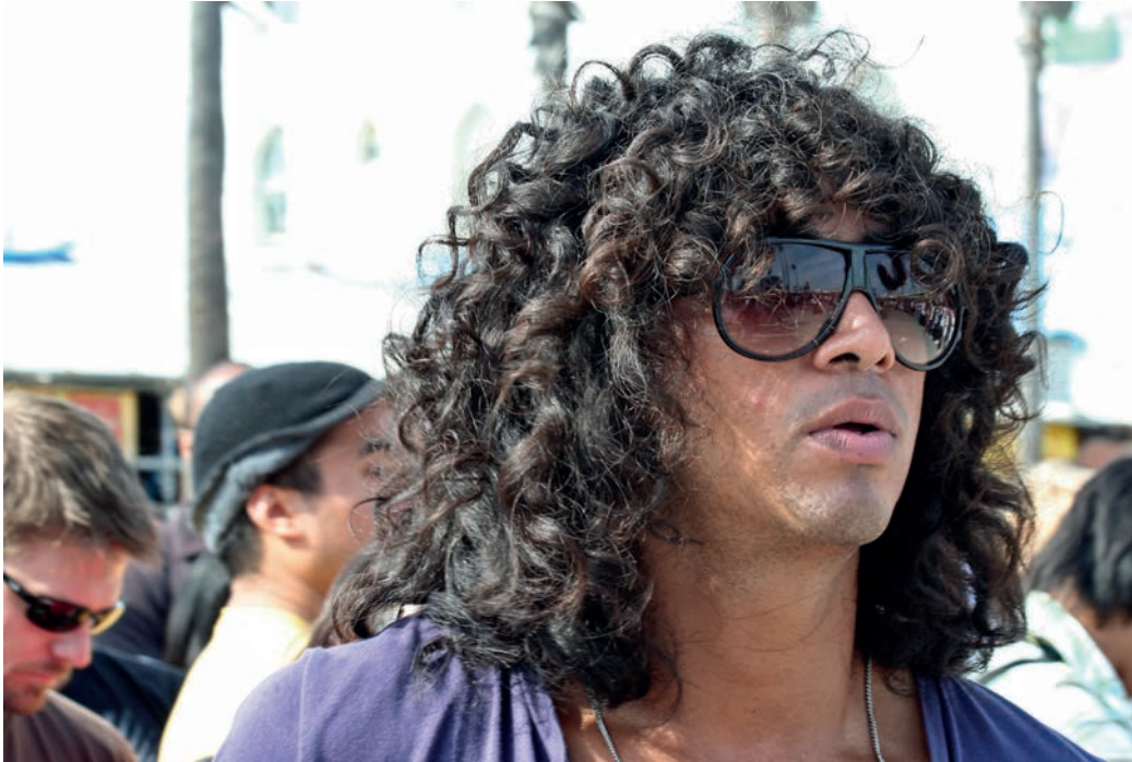
Fotografia uliczna, portret. Los Angeles, Venice Beach.

oni zazwyczaj zdjęciu ostateczny szlif bądź na bazie obrazu wyjściowego tworzą zupełnie nowe zdjęcie.